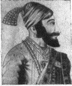
दुसरें तें राजकारण ।